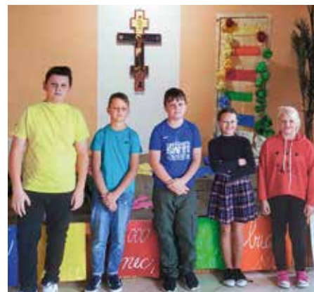
Deti sa predmodlievali ruženec

V súvislosti a akciou Milión detí sa modlí ruženec nám porozprávala o sile modlitby ruženca. Dokázala nám, že ruženec je krátka, ale silná modlitba. Povedala nám dojmavý príbeh o chlapcovi, ktorý priniesol kráľovi - Pánu Bohu - malé obyčajné jablko a kráľovná Panna Mária ho zmenila