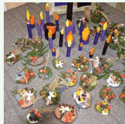
Takéto pekné ikebany sa podarilo urobiť našim piatakom