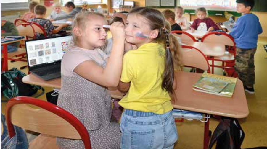
Maľovanie vlajok rôznych štátov

trieda 4.B hrala slovensko-nemecké a anglické pexeso. 5.A hrala futbal v ukrajinských dresoch proti šiestakom oblečených v dresoch Estónska. 5.B sa učila ruskú pieseň. 6.A okrem futbalu ešte písala azbuku. Siedmáci