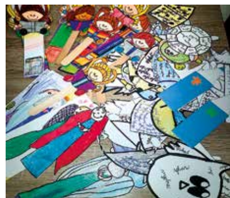
Naše záložky pre deti z obce Skačany

Literárne múzeum a Národný cintorín v Martine. Tradične zapálili sviečky pri hrobkách našich národných dejateľov a venovali im krátku modlitbu. Ich život a dielo si tiež pripomenuli tvorbou projektov. Decká si tiež mohli vychutnať divadlo. Za menšími deťmi prišli divadelníci do školy a deviataci vycestovali do Mestského divadla v Žiline. Ale to už je iný článok.