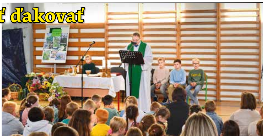
Svätá omša pri príležitosti poďakovania za úrodu

V telocvični sa na svätej omši stretla celá škola, aby sme poďakovali za úrodu, ktorú nám v tomto roku Pán Boh požehnal. Celú slávnostnú atmosféru dotvárala aj výzdoba z našich záhrad.