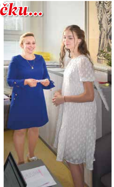
Anjelskú poštu dostala aj pani riaditeľka

Hneď ráno sme si o anjeloch strážnych – archanjeloch Michaelovi, Rafaelovi a Gabrielovi vypočuli rozhlasové pásmo. Takto sme si pripomenuli, že všetci máme ochrancu, ktorý je pri nás od narodenia až po smrť či sme kresťania alebo nie. Okrem ochrancu predstavuje náš anjel strážny aj pastiera, ktorý nás má viesť do večného života. Zasahuje potichu, plniac si svoju úlohu tak pokorne, ako je to len možné, bez toho, aby sme o tom vedeli. Tento sviatok bol ustanovený už v roku 1670 pápežom Klementom X.