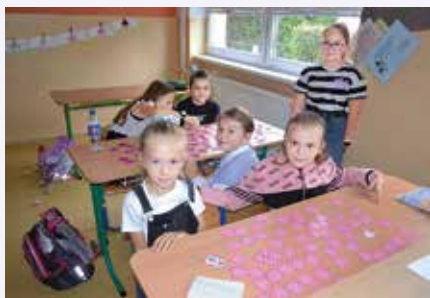
Štvrtáčky pri hre pexesa

Zo školského rozhlasu sme si vypočuli Európsku hymnu a krátky príhovor. Žiaci potom robili so svojimi triednymi učiteľmi rôzne aktivity. Prváci sa učili povedať AHOJ po česky, poľsky a anglicky. Druháci kreslili vlajky rôznych krajín. Tretiaci tiež kreslili vlajky a rôzne obrázky. Žiaci 4.A triedy si maľovali na tvár. Naša