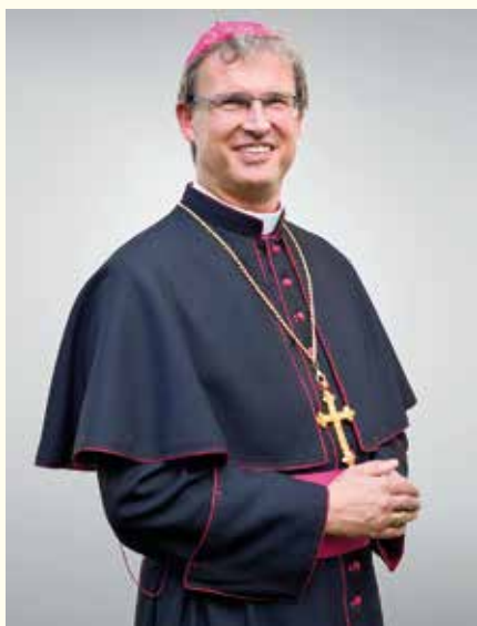
SPIŠSKÝ DIECÉZNY BISKUP MONS. FRANTIŠEK TRSTENSKÝ