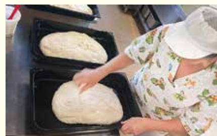
S pečením chleba nám pomáhali pani kuchárky

Aj v tomto školskom roku sme si uctili Svetový deň chleba. Pani upratovačky spolu s pani učiteľkami vymiesili cesto a v školskej jedálni nám ho tety kuchárky upiekli.