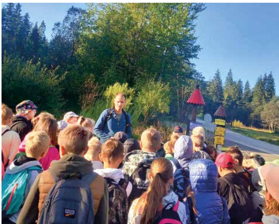
...v Juráňovej doline...