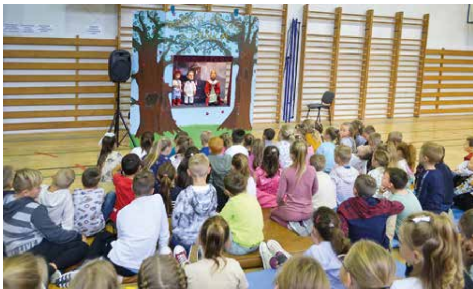
Bábkové divadlo Lienka zavítalo medzi našich najmenších žiakov