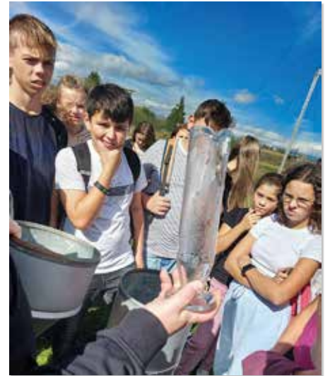
-red- ...v Meteorologickej stanici v Liesku ...

Žiaci si touto exkurziou prakticky upevnili teoretické vedomosti z geografie a fyziky.