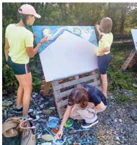
...takto sme tvorili...