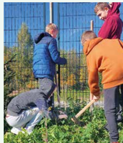
Žiaci ôsmeho ročníka pri sadení stromčekov