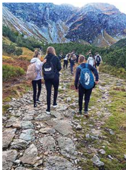
...smer Roháčske plesá...