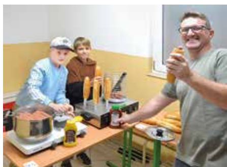
Piataci stavili na hot-dogy