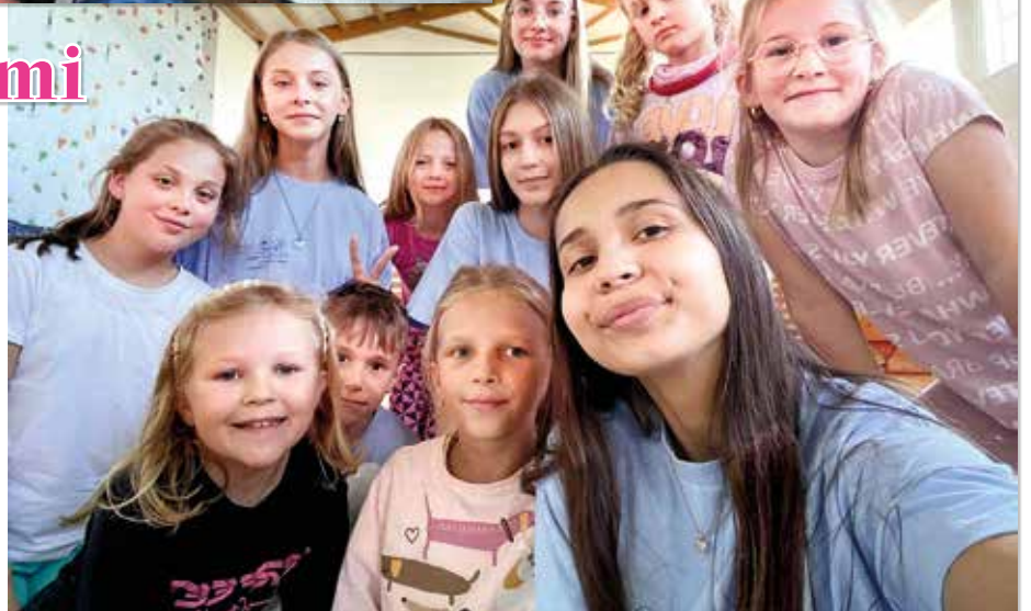
Animátorky s deťmi

Naposledy sme sa zahráli na princeznú, rytierov a mudrcov formou