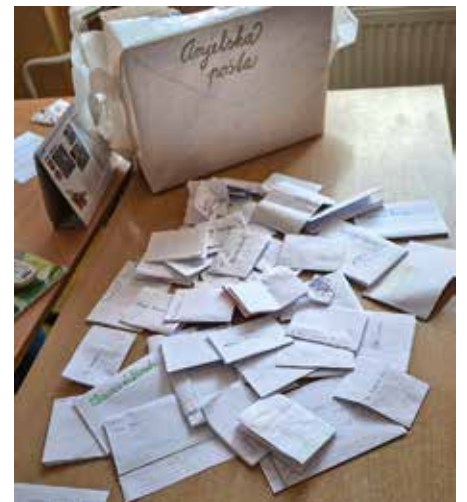
Listy čakajú na svojich adresátov