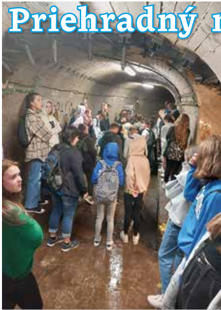
...v priehradnom múre...

V piatok 22. septembra sa žiaci 7. a 8. ročníka zúčastnili exkurzie na Priehradný múr v Námestove a na Meteorologickú stanicu v Liesku.