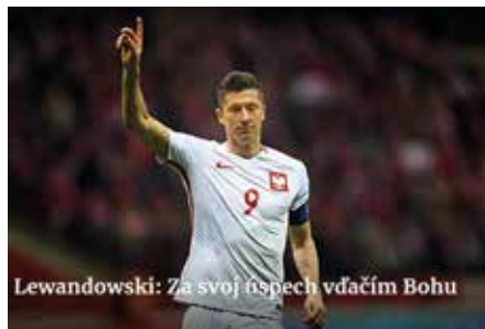
Lewandowski: Za svoj úspech vďačím Bohu