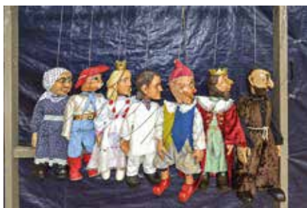
Deti sa mohli s bábkami aj pohrať

Pre žiakov prvého, druhého a tretieho ročníka si bábkoherci 13. októbra pripravili divadelné predstavenie Kocúr v čižmách. Zahrali ho deťom v našej telocvični.