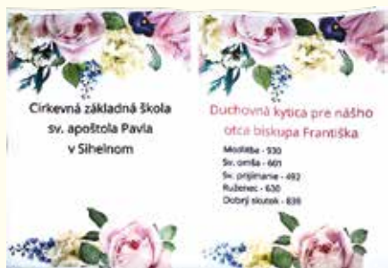
Naša duchovná kytica pre otca biskupa Františka