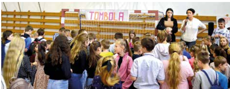
Veľký úspech mala tombola