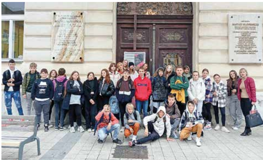
V literárnom múzeu v Martine