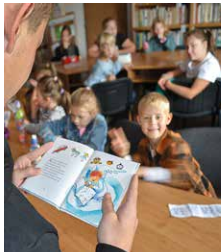
Žiaci ôsmeho ročníka čítali počas veľkých prestávok menším deťom príbehy o anjelikovi Riškovi