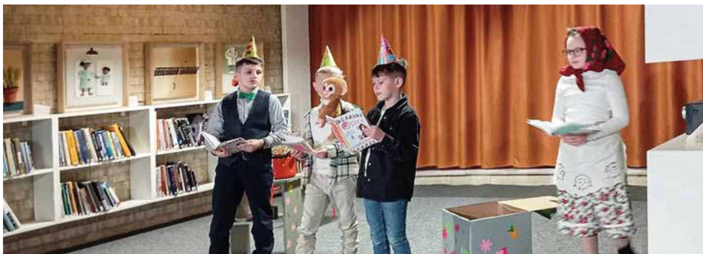
Deti na scénickom čítaní v Námestove