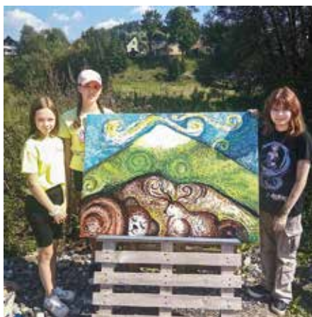
...takéto dielko sa nám podarilo vytvoriť...