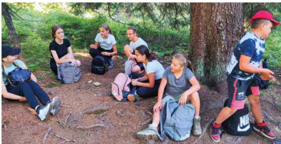
...výstup na Pilsko...