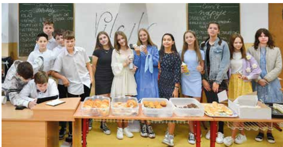
Kaviarne boli na jarmoku veľmi žiadané. Jednu prevádzkovali aj ôsmaci