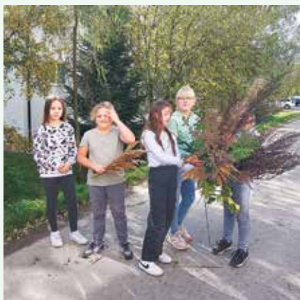
...na zbere prírodnín do našich dušičkových ozdôb...