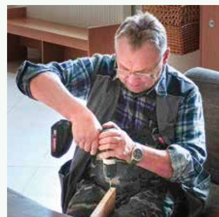
Pán školník pri práci