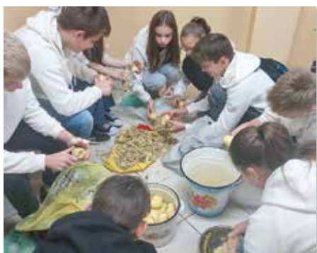
Deviataci poctivo makali a vyplátilo sa. Zarobili najviac