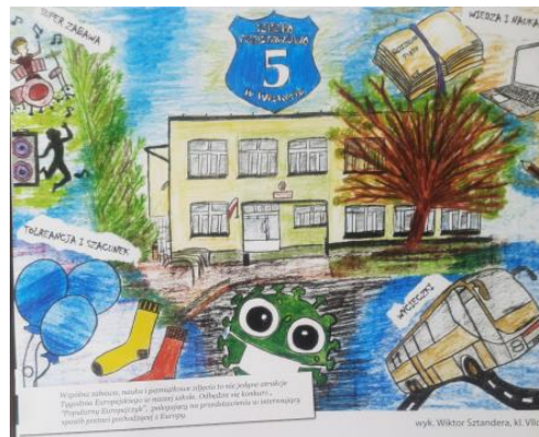
Wiktor Sztandera, kl. VIII