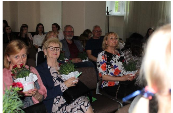
Honorowi goście koncertu – emerytowani nauczyciele