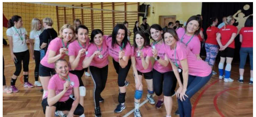
Wicemistrzyni turnieju pokoleń