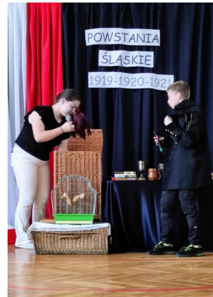
Scena z przedstawienia w wykonaniu uczniów klas siódmych

Biuletyn stanowi opis wszystkich przedsięwzięć, które podjęliśmy jako społeczność szkoły dla uczczenia jubileuszu 60-lecia jej powstania. Chcieliśmy w tej formie ocalić od zapomnienia i zachować dla przyszłych pokoleń te niezwykle chwile.