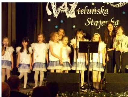
Występ uczniów z "Piątki"