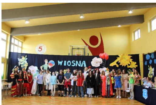
Konkurs na najciekawszy strój wiosenny - prezentacja