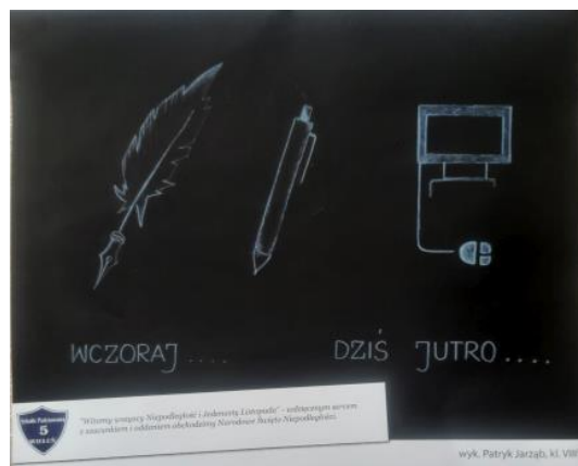
Patryk Jarzab, absolwent