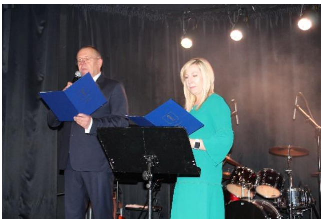
Przemówienie dyrekcji szkoły