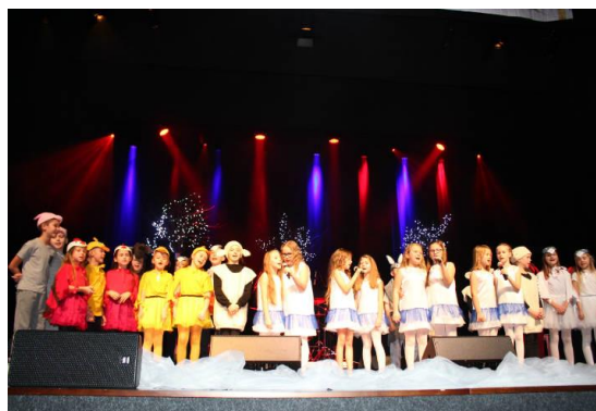
Występ uczniów z "Piątka"