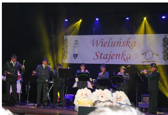
Występ Sygnalistów Myśliwskich z Wielunia