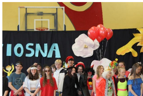
Konkurs na najciekawszy strój wiosenny - prezentacja