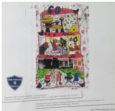
Oliwia Bednik, kl. III