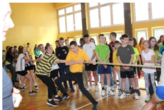
Wiosenne zawody sportowe