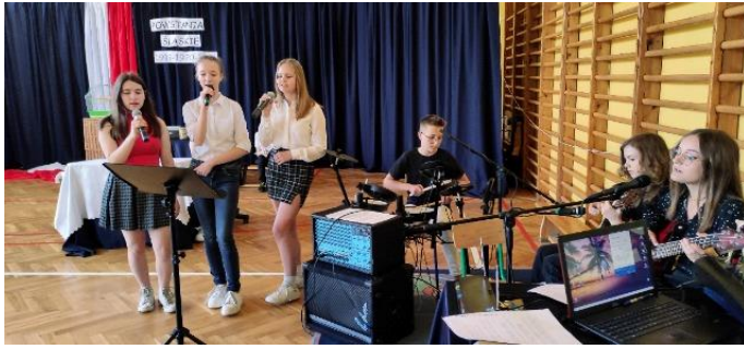
Piosenki śląskie w wykonaniu uczennic z klas siódmych