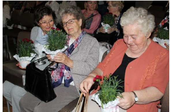
Honorowi goście koncertu – emerytowani nauczyciele