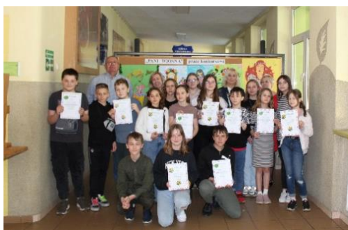
Nagrodzeni uczniowie klas IV-VI w konkursie na wiersz o "Wiosnie"