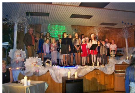
Występ uczniów z "Piątki"