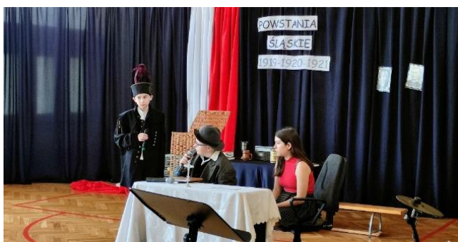
Scena z przedstawienia w wykonaniu uczniów klas siódmych