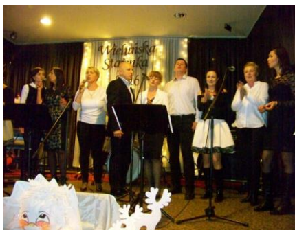
Występ Rady Rodziców