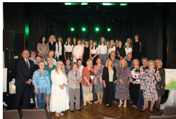
"Znów razem" – wspólne zdjęcie uczestników koncertu