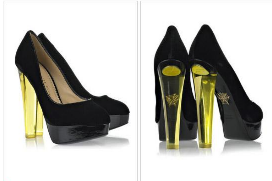
Luxusný pár topánok - Charlotte Olympia