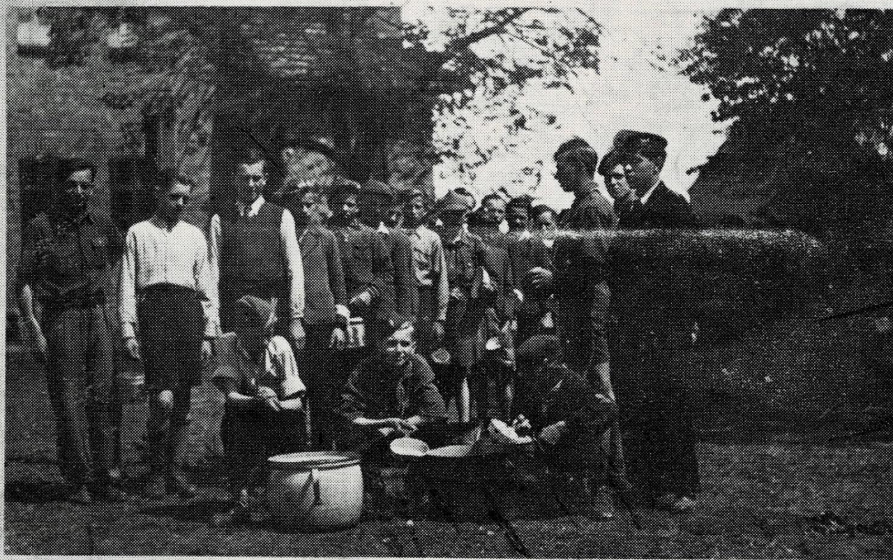
21. Uczestnicy biwaku w Kopankach

Przygotowany w dyskrejacji przed rodzicami obchód Święta Matki rozpoczął się marszem dziatwy szkolnej ze sztandarem do Kościoła w Bukowcu. Po południu odbyła się uroczysta akademia w świetlicy, w czasie której dzieci wśród deklamacji i śpiewu zeszły ze sceny na widownię, wręczając zebrany matkom bukiety kwiatów. Nastroj panował serdeczny.