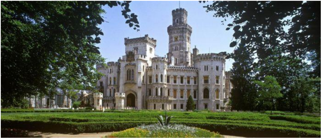
Hluboká nad Vltavou