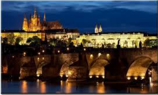
Praha v noci