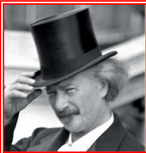
Ignacy Jan Paderewski