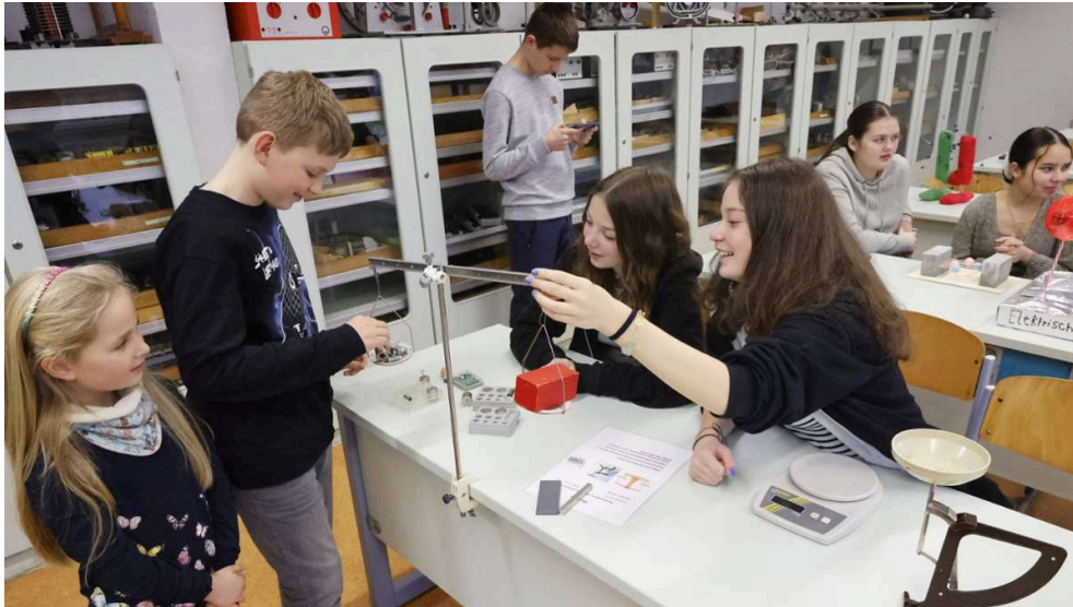
Gar nicht so einfach, das Gewicht von Gegenständen mit unterschiedlicher Dichte zu schätzen.