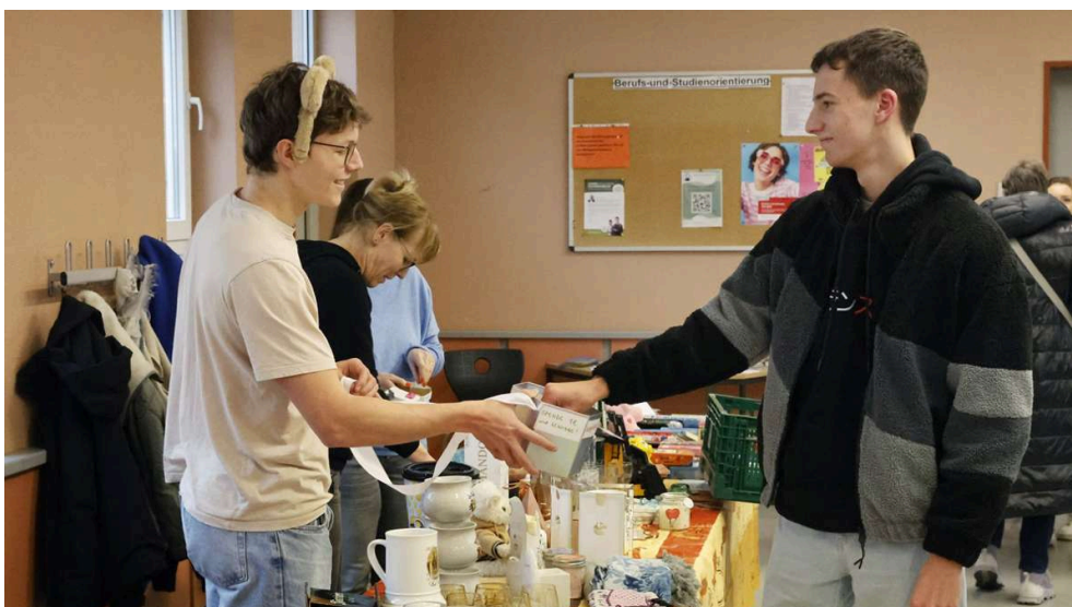
Lose für die Flohmarkt-Tombola, damit sich die Abikasse füllt.

In der Aula können sich Besucher eine Pause gönnen, die die Mitglieder des Schulfördervereins mit Getränken verwöhnen. Zugleich machen sie auf das Wirken der derzeit 120 Mitglieder für das Gymnasium aufmerksam, das allen Schülern ungemein zugute kommt. Für die Abikasse ist ein Kuchenbasar vorbereitet und von den Eltern der künftigen Abiturienten ein Tombola-Flohmarkt, damit Abizeitung, -fahrt und -ball finanziert werden können.