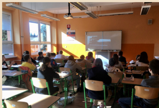
Žiaci VII.B triedy počas sledovania 6 minútového dokumentu