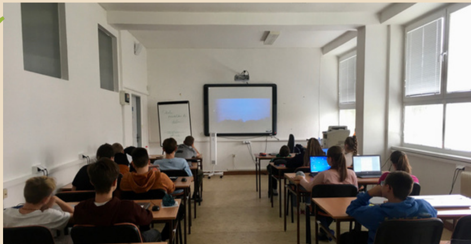
Žiaci VII.D triedy počas sledovania 6 minútového dokumentu

Na záver sa zhodli na myšlienke: "Že netreba sa starať do druhých, ale treba sa starať o druhých".