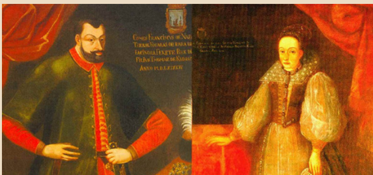
Portréty Alžbety Bathoryovej a jej manžela Františka Nádasdyho zo 16. storočia

Na obrázku môžete vidieť šľachtickú ženskú módu z čias Alžbety Báthoryovej. Šaty, vyrobené z honosných materiálov ako hodváb, zamat a atlas, sú vernou kópiou tých, ktoré má Alžbeta Bathory oblečené na svojom najznámejšom obraze.