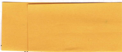
Renata Gromek podpis štatutárneho zástupcu