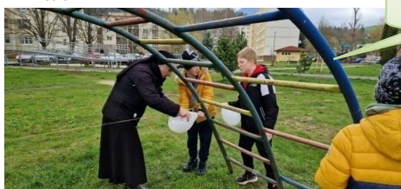
Veda na ulici