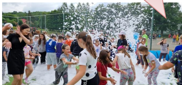
Koniec školského roka