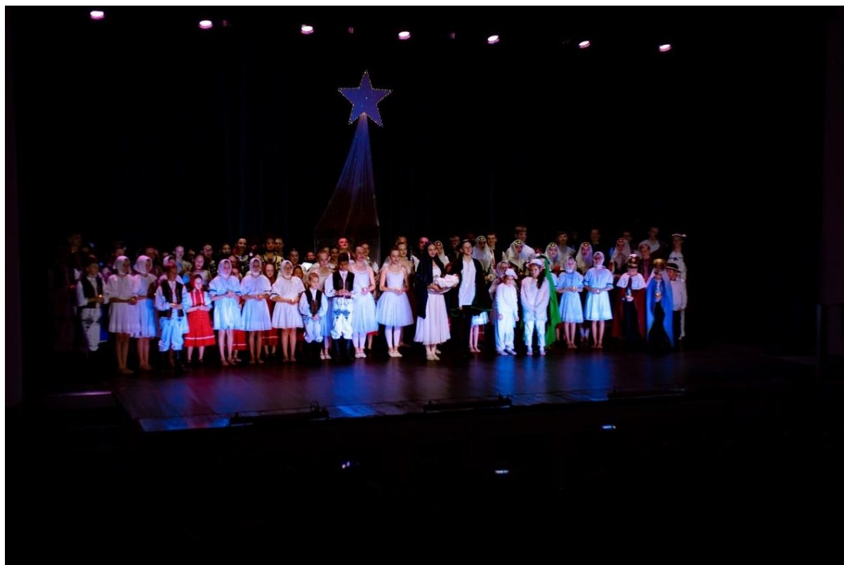
obr. č. 2 Vianočný koncert ZUŠ 16. 02. 2022.