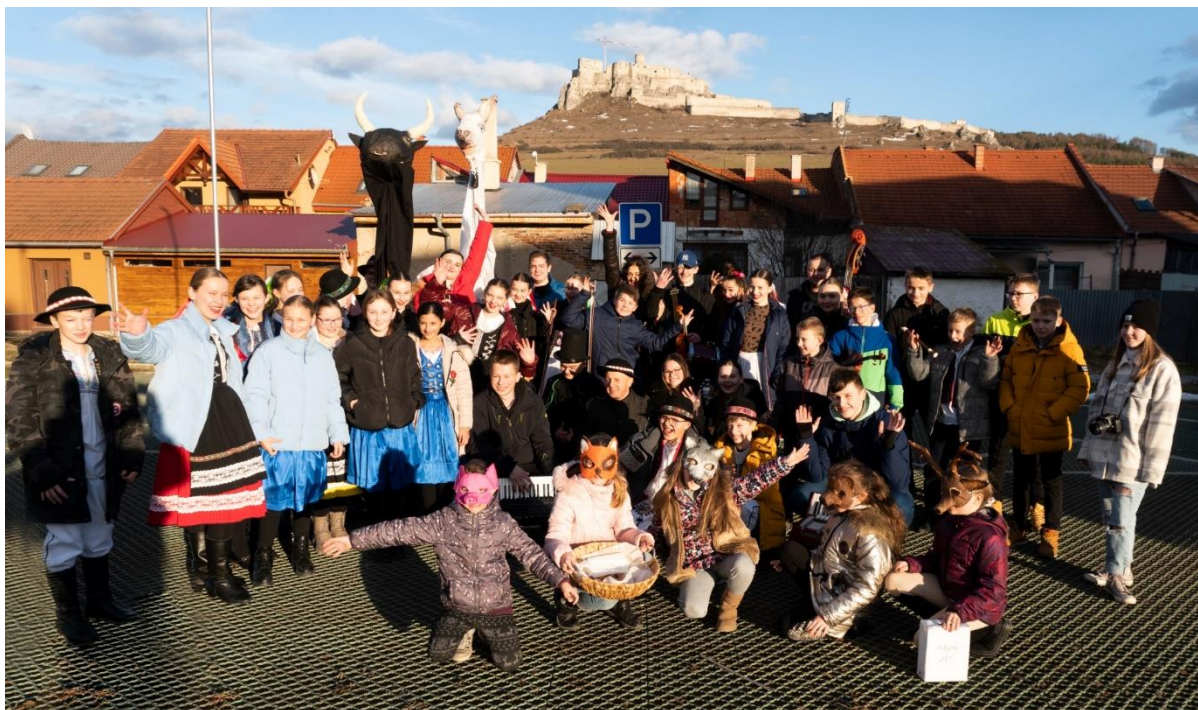
obr. č. 3

Fašiangový sprievod mestom Spišské Podhradie.