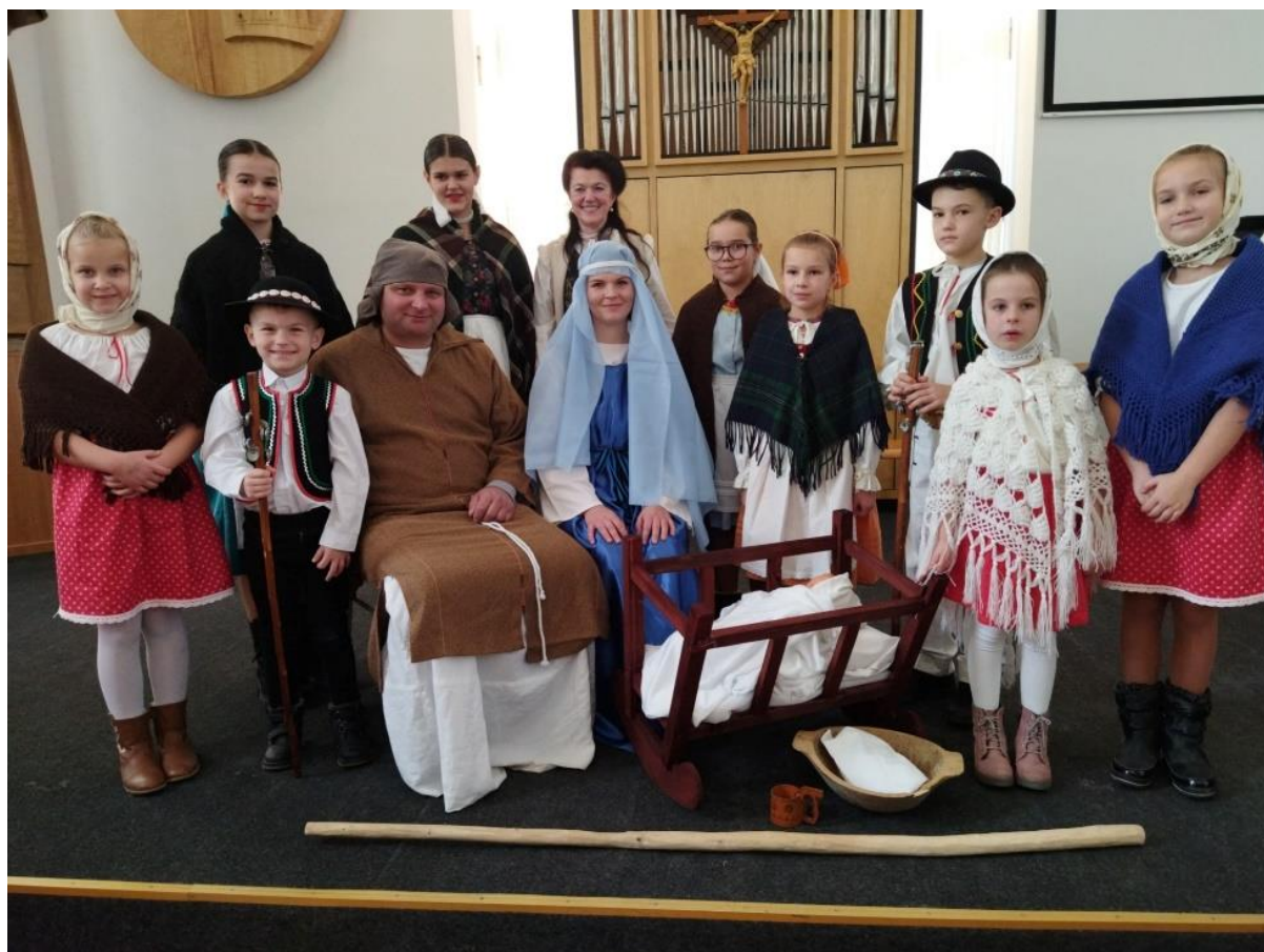
obr. č. 1

Vianočný a adventný koncert DFS Dreveník v Spišskej Kapitule.